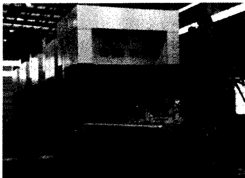
图2 带缓冲装置的RZU2000大型快速单动冲压液压机

本装置与RZU2000大型快速冲压液压机配套,已在江淮集团常青机械厂汽车覆盖件生产线上得到应用,如图2所示。整机工作时冲压噪声小于80dB,改善了工人的工作环境,实现了冲压件质量的提高。